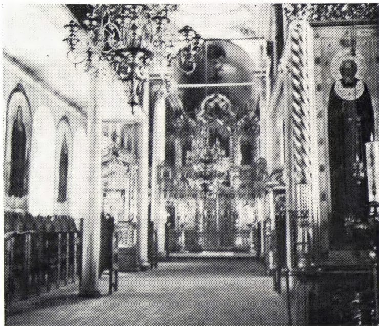
Русский Пантелеимонов монастырь на Афоне. Придел в честь святого князя Александра Невского в храме Покрова Божией Матери (К ст. на с. 2)